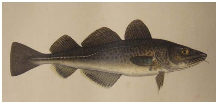
Torsk V von Wright

Torsken ( Gadua Morrhu Linn.) kan uppnå en längd af 4 fot, då den väger omkring 2 lispund, men de fleste som nu fångas wid Bohuslän hålla blott 12 till 20 tum.